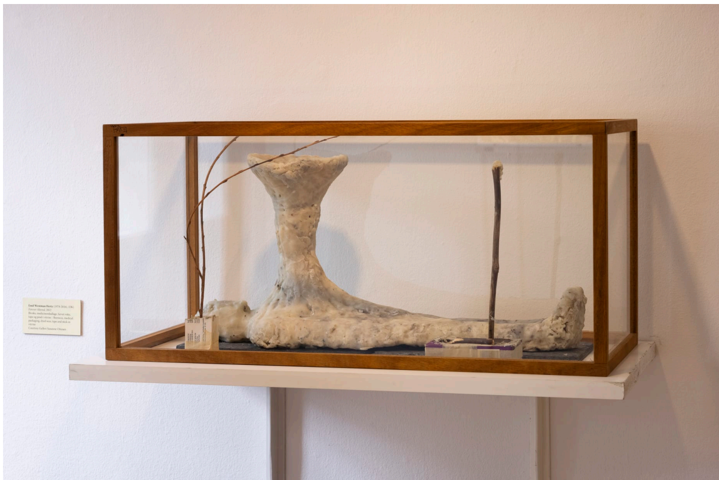
Westman Hertz, 'Face of Another' (2012)

kunst. Her i rummet hænger et af Westman Hertz' mest poetiske og sorgfulde værker, Face of Another (2012), hvor en menneskefigur er formet i bivoks og ligger inde i en montre – som en kiste, et hvilested, hvor der også er medicinæsker, der bruges som sokkel til grene. Fra menneskefigurens bryst vokser en svampelignende figur. Mutationen mellem arter og vækster er ofte på færde i Westman Hertz værker, men her bliver det både meget syret og meget konkret: Fra vores organisme vokser der nye frem. Vores død skaber nyt liv.